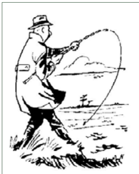
Het verenigingslogo anno 1956.

Op de naleving van de regels werd toezicht gehouden door twee leden die als controleurs werden aangesteld: Henk Serlijn en Cor Bartling. Op overtredingen stonden